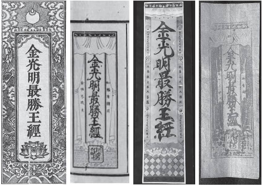
図六: 右より1〈近世秋葉山の御札(筆者蔵)〉 2〈近世の掛軸(筆者蔵)〉 3〈「正徳三年版」の挿絵(金剛院蔵)〉 4〈「秋葉藏版」の挿絵(總持寺祖院蔵)〉

うにみると、信者に頒布した授与品の中には、『最勝王経』を意匠として用いたものがあり、しかもバリエーションがあったことが看取される。また別の角度から指摘をすれば、これらの例は、秋葉山が信者に頒布していた御札等の威力の根源が『最勝王経』に拠っていたことを示している。これらの点から、秋葉山が『最勝王経』を重視していたことは疑いないだろう。