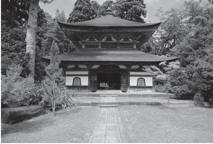
【図版1】祖院経蔵外観