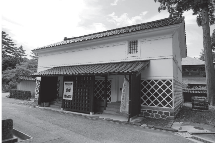
【図版3】祖院白山藏外観